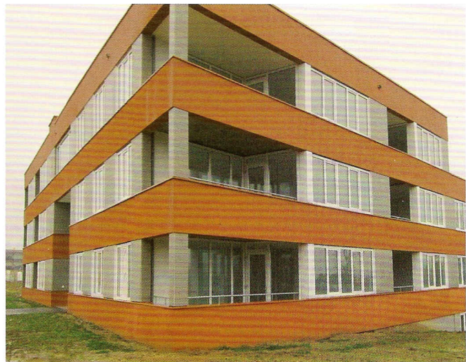
Het uiteindelijke resultaat is bereikt door verschillende stroken te creëren: sierpleister wordt afgewisseld met tegelafwerking.

Het StoTherm Vario systeem met tegelafwerking is niet alleen op decoratief niveau een goede keuze. Ook op de lange termijn biedt dit systeem zekerheid, zo blijkt ook uit de 10 jaar niet aflopende verzekerde garantie die op dit systeem gegeven kan worden (SGG o.g.).